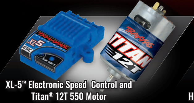
XL-5™ Electronic Speed Control and Titan® 12T 550 Motor