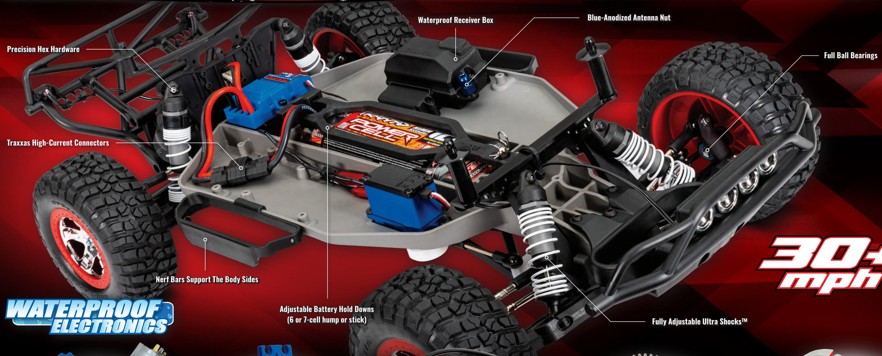
Precision Hex Hardware

The Traxxas Slash Short-Course Race Truck puts you in the drivers seat for intense fender-to-fender, high-flying off-road action. The full-scale Short-Course Race Trucks embody the spirit of Traxxas R/C with their extreme 900+ horsepower racing engines full-throttle, dirt-roosting power slides, giant suspension travel, and Supercross-style big-air jumps. The Traxxas Slash brings all the action home so you can experience the high-speed head-to-head competition at the track or in your own backyard. The Slash was inspired by the TORC™ (THE Off-Road Championship) Pro 2WD class. The Traxxas Slash hangs it out for an all new way to challenge your driving skills.