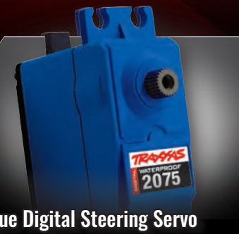
High-Torque Digital Steering Servo