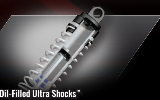
Oil-Filled Ultra Shocks™