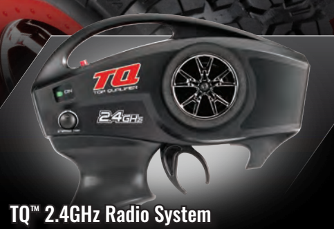
TQ™ 2.4GHz Radio System