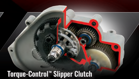
Torque-Control™ Slipper Clutch