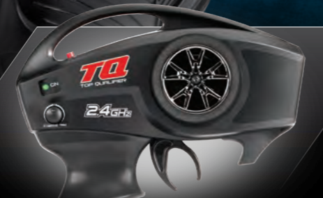
TQ™ 2.4GHz Radio System