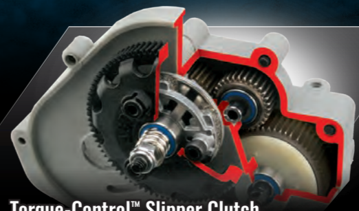
Torque-Control™ Slipper Clutch