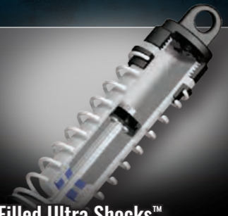
Oil-Filled Ultra Shocks™