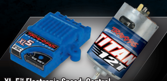
XL-5™ Electronic Speed Control and Titan® 12T 550 Motor