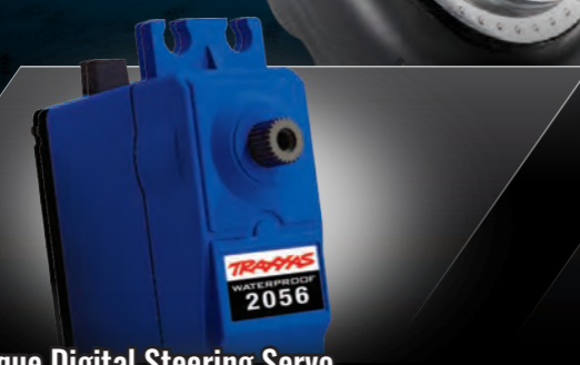
High-Torque Digital Steering Servo