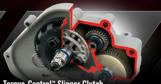
Torque-Control™ Slipper Clutch