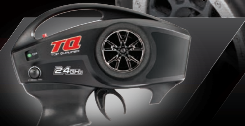
TQ™ 2.4GHz Radio System