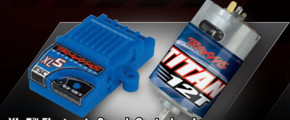
XL-5™ Electronic Speed Control and Titan® 12T 550 Motor