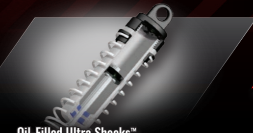
Oil-Filled Ultra Shocks™