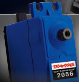
High-Torque Digital Steering Servo