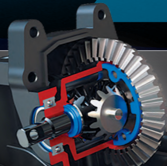
Sealed Steel-Gear Differentials