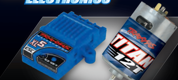
XL-5™ Electronic Speed Control and Titan® 12T 550 Motor