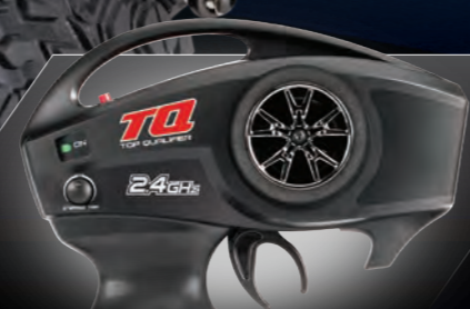
TQ™ 2.4GHz Radio System