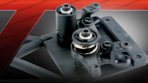
Bellcrank Steering with Integrated Servo Saver