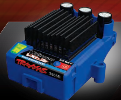
Velineon® VXL-3s Electronic Speed Control