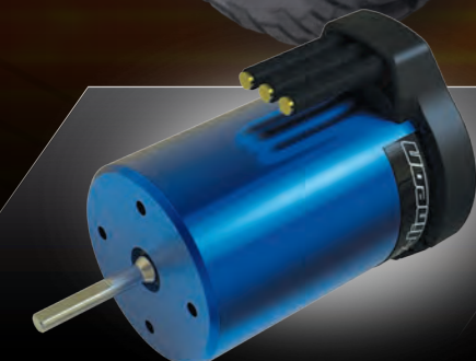
Velineon® 3500 Brushless Motor