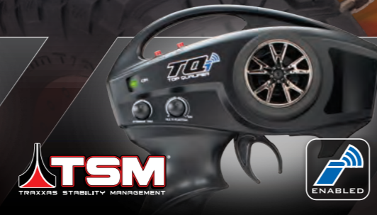
TQi™ 2.4GHz Radio System with TSM®