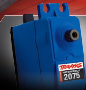
High-Torque Digital Steering Servo