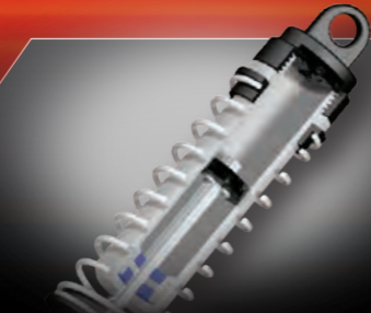
Oil-Filled Ultra Shocks™