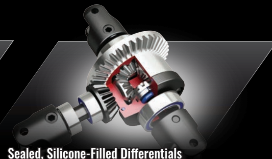
Sealed, Silicone-Filled Differentials