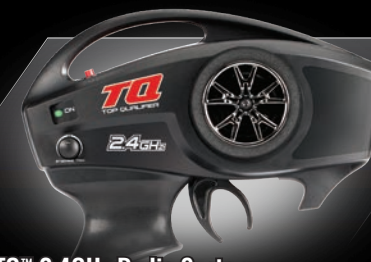
TQ™ 2.4GHz Radio System