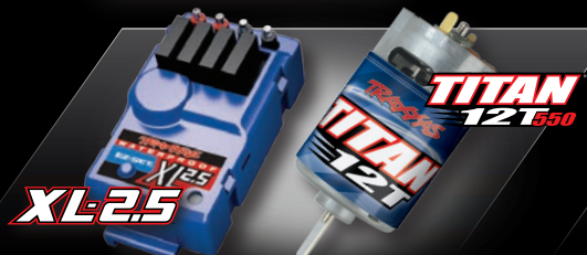
XL-2.5 ESC & Titan® 12-Turn 550 motor