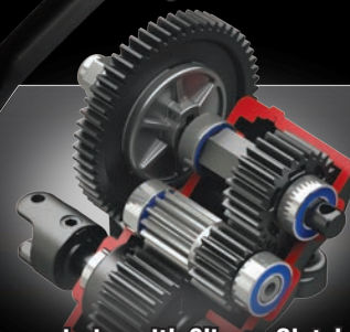
Ball-Bearing Transmission with Slipper Clutch