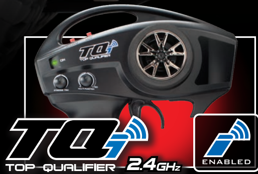
TQi TOP QUALIFIER 2.4GHz