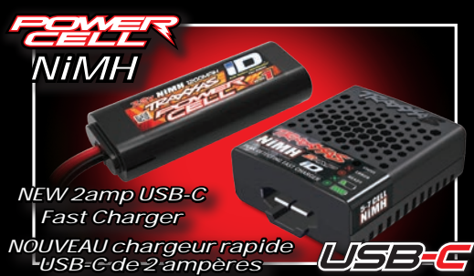
POWER CELL NiMH NEW 2amp USB-C Fast Charger NOUVEAU chargeur rapide USB-C de 2 ampères