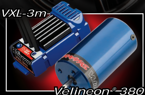
Velineon ® -380